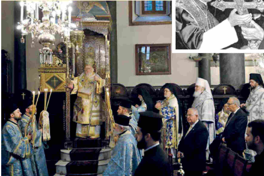
Sopra: papa Paolo VI incontra il patriarca di Costantinopoli Atenagora. A sinistra: celebrazione dell'Epifania nella cattedrale di San Giorgio, a Istanbul, presieduta dal patriarca Bartolomeo I.