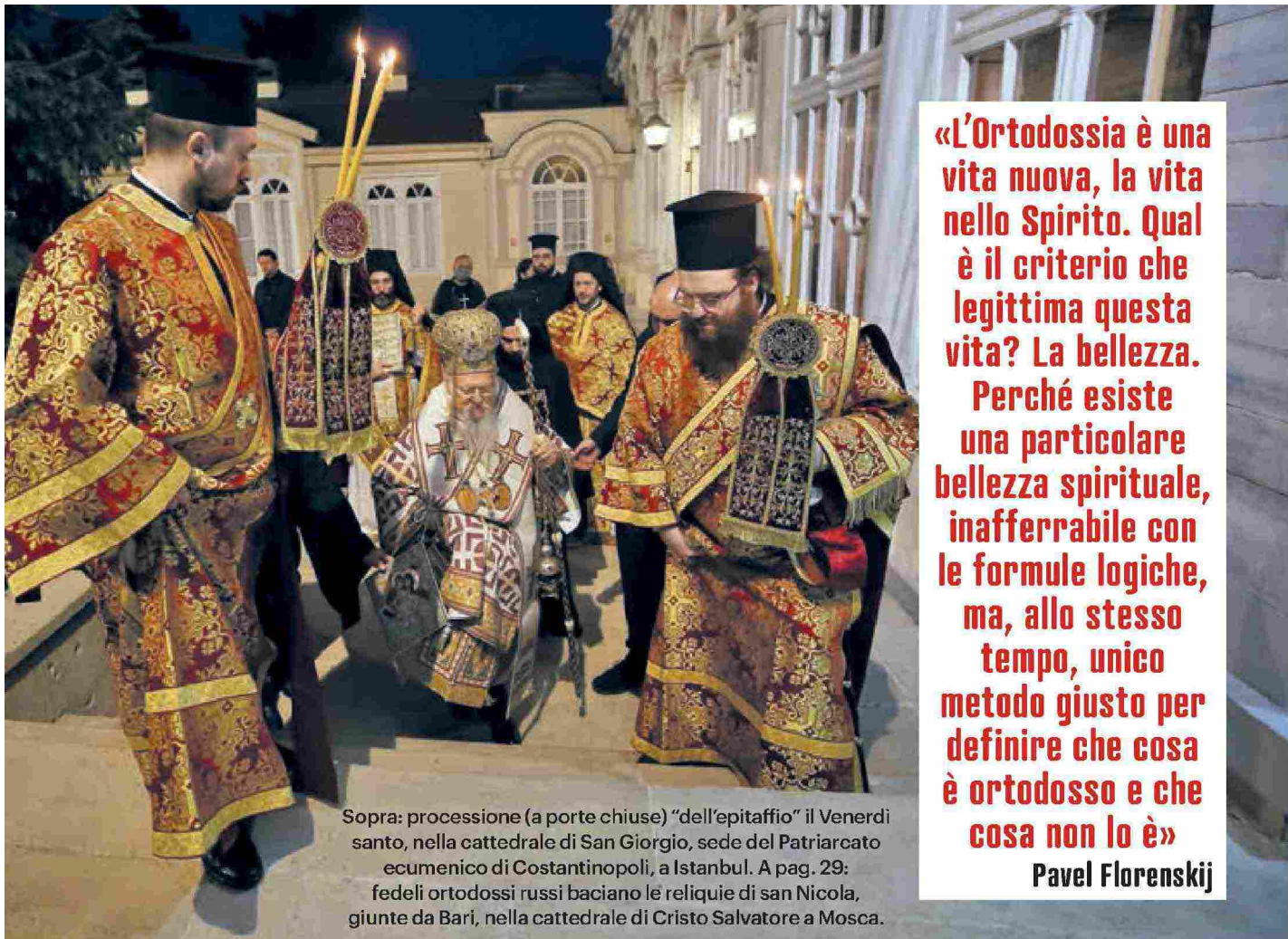
Sopra: processione (a porte chiuse) "dell'epitaffio" il Venerdi santo, nella cattedrale di San Giorgio, sede del Patriarcato ecumenico di Costantinopoli, a Istanbul. A pag. 29: fedeli ortodossi russi baciano le reliquie di san Nicola, giunte da Bari, nella cattedrale di Cristo Salvatore a Mosca.

«L'Ortodossia è una vita nuova, la vita nello Spirito. Qual è il criterio che legittima questa vita? La bellezza. Perché esiste una particolare bellezza spirituale, inafferrabile con le formule logiche, ma, allo stesso tempo, unico metodo giusto per definire che cosa è ortodosso e che cosa non lo è»